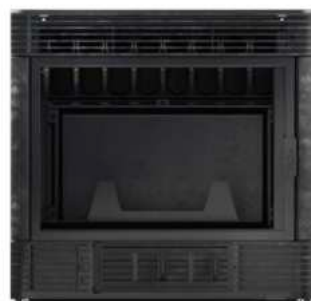
VALAIS 650T FR9011200B

Dimensions (L x H x P) : 76 x 61,5 x 48 cm