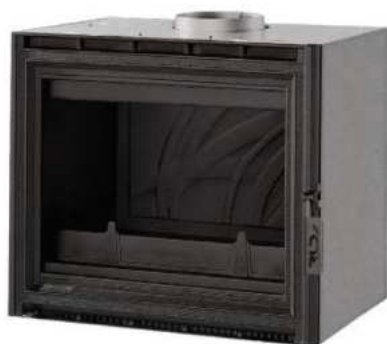
CLOVIS 800 FR9011170B

À travers leur design rustique, nos inserts captent l'essence même de la tradition. Chaque détail, des finitions en fonte aux motifs classiques, témoigne de notre engagement envers la qualité et l'artisanat.