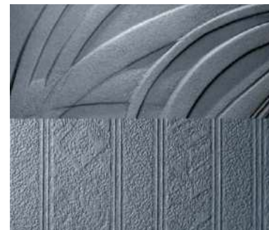
Intérieur en plaque d'âtre réversible (2 motifs disponibles pour CLOVIS 800).

Dimensions (L x H x P) : 65 x 53 x 41,5 cm