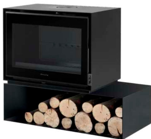
BELLEVILLE 700 CL FR9011020B

Dimensions (L x H x P) : 67 x 92 x 51 cm