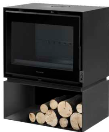
BELLEVILLE 700 C FR9011010B

Ces produits ont été méticuleusement conçus pour offrir une expérience unique, permettant à chacun de profiter pleinement du spectacle réconfortant du feu directement depuis son salon . Son design aux formes cubiques ne se contente pas d'apporter une chaleur physique, mais également une élégance et un chic indéniables à votre maison. Les lignes épurées et modernes s'inscrivent parfaitement dans les tendances contemporaines.