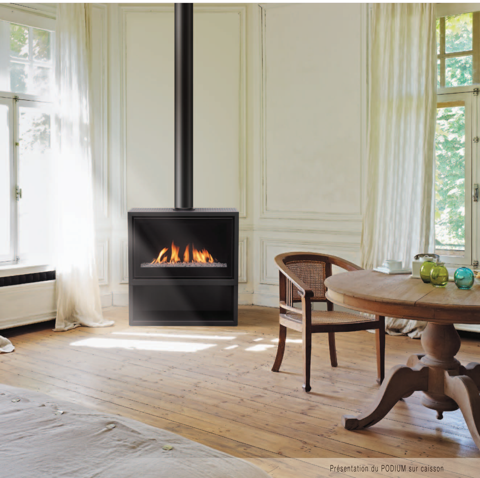
Présentation du PODIUM sur caisson