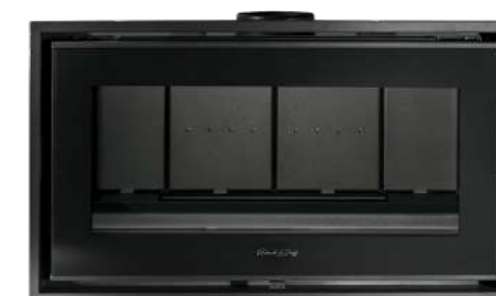
HONORÉ 1000 FR901150B EAN : 3760075412142