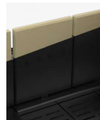
Renfort intérieur en vermiculite et acier.