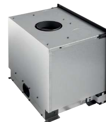
Distribution d'air prédécoupé (en option)