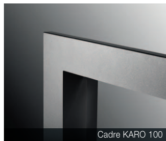
Cadre KARO 100