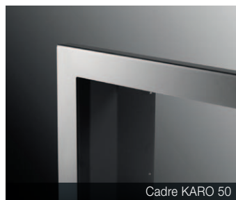
Cadre KARO 50