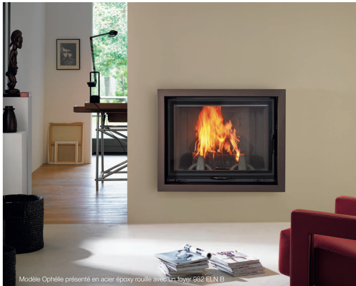
Modèle Ophélie présenté en acier époxy rouille avec un foyer 982 ELN B