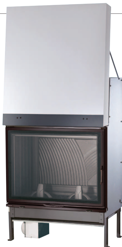
982 ELN B