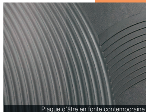
Plaque d'âtre en fonte contemporaine